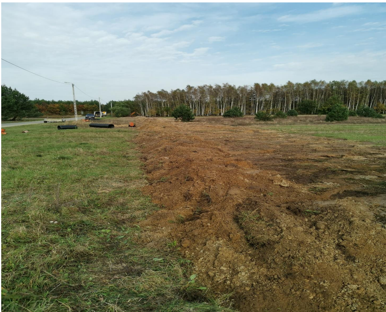
Fot. Budowa kanalizacji sanitarnej w miejscowości Dzikowiec i Wilcza Wola w trakcie realizacji

W 2020 roku zostały wykonane projekty przebudowy, budowy i rozbudowy kanalizacji sanitarnej i sieci wodociągowej na terenie Gminy Dzikowiec.