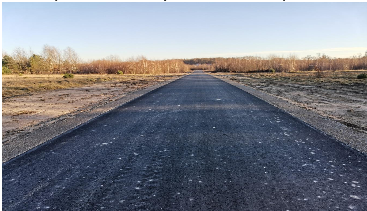
Fot. Wykonana przebudowa drogi nr 104 314 R Dzikowiec – Lipnica