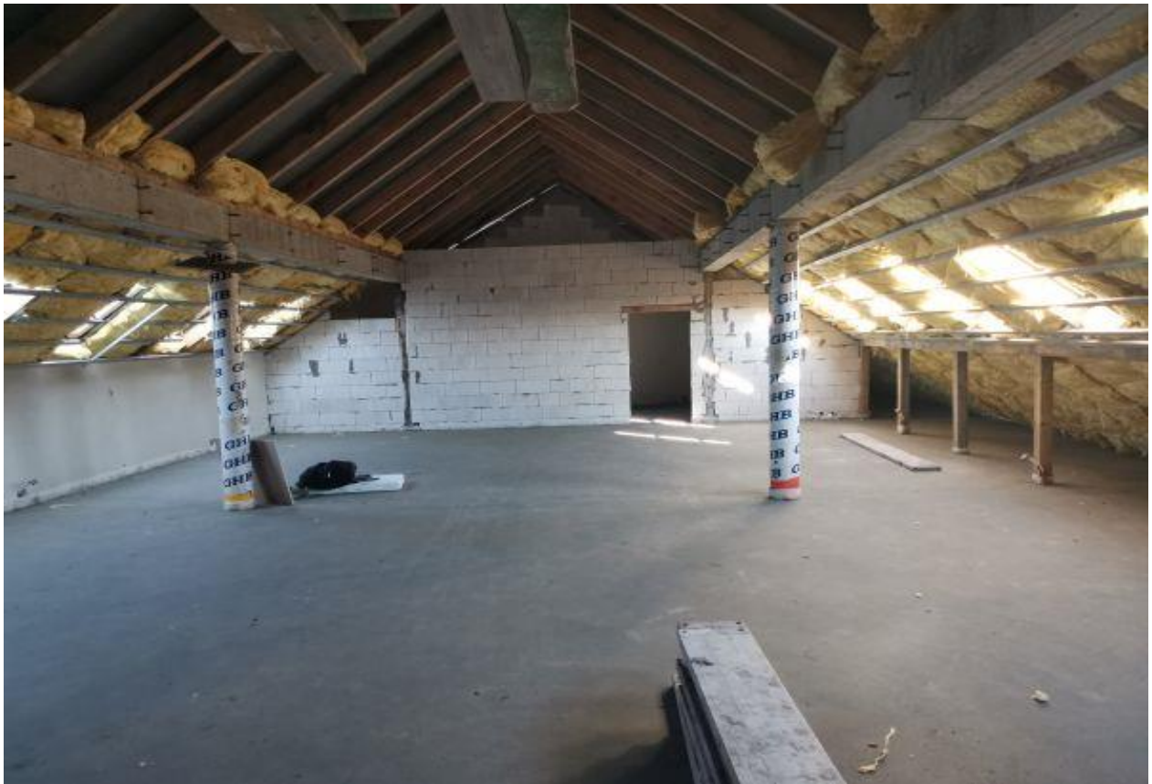
Fot. Rozbudowa i przebudowa budynku wielofunkcyjnego w Kopciach

Kolejnym przedsięwzięciem realizowanym przez Gminę Dzikowiec w 2020 roku była rewaloryzacja zabytkowego parku w Dzikowcu. W ramach tego zadania zostało wykonane oświetlenie zewnętrzne parku oraz zamontowano ławki parkowe.