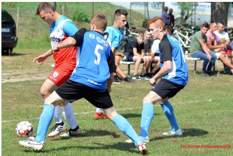
Fot. Stadion Sportowy w Kopciach – mecz Klub Sportowy Kopcie – Klub Sportowy Cigany

Zarząd Klubu, zawodnicy jak i sympatycy Klubu śmiało angażują się w działalność około sportową Klubu. Przykładami mogą być wolontariusze który z własnych chęci pomagają w porządkach oraz utrzymaniu obiektu sportowego dzięki czemu mimo aktualnej klasy rozgrywkowej, obiekt spełnia standardy wyższych klas rozgrywkowych.