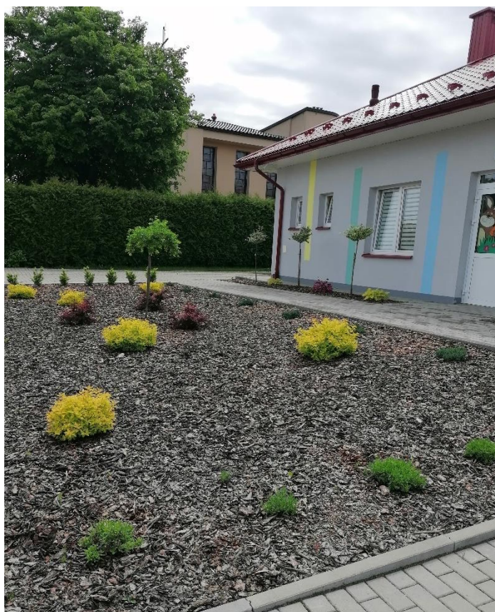
Fot. Nasadzenia przy Klubie Dziecięcym w Lipnicy