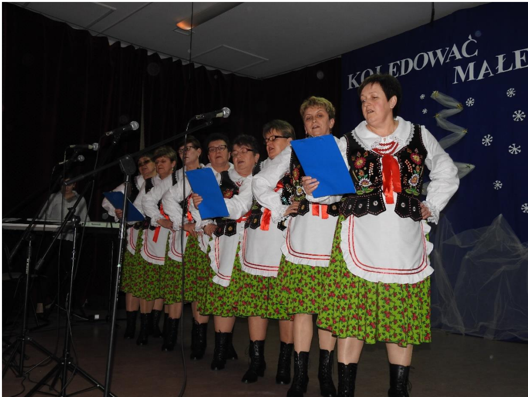
Fot. Występ KGW „Prymule” z Mechowca