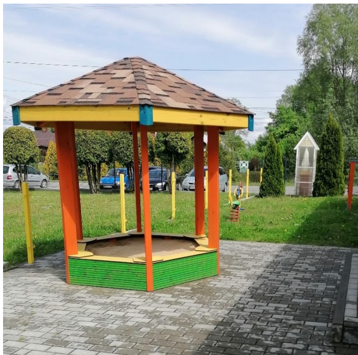
Fot. Plac zabaw przy Klubie Dziecięcym w Lipnicy

emocjonalnym, językowym oraz ruchowym. Przyczyniła się również do budowania przez podopiecznych stabilizacji oraz poczucia bezpieczeństwa.