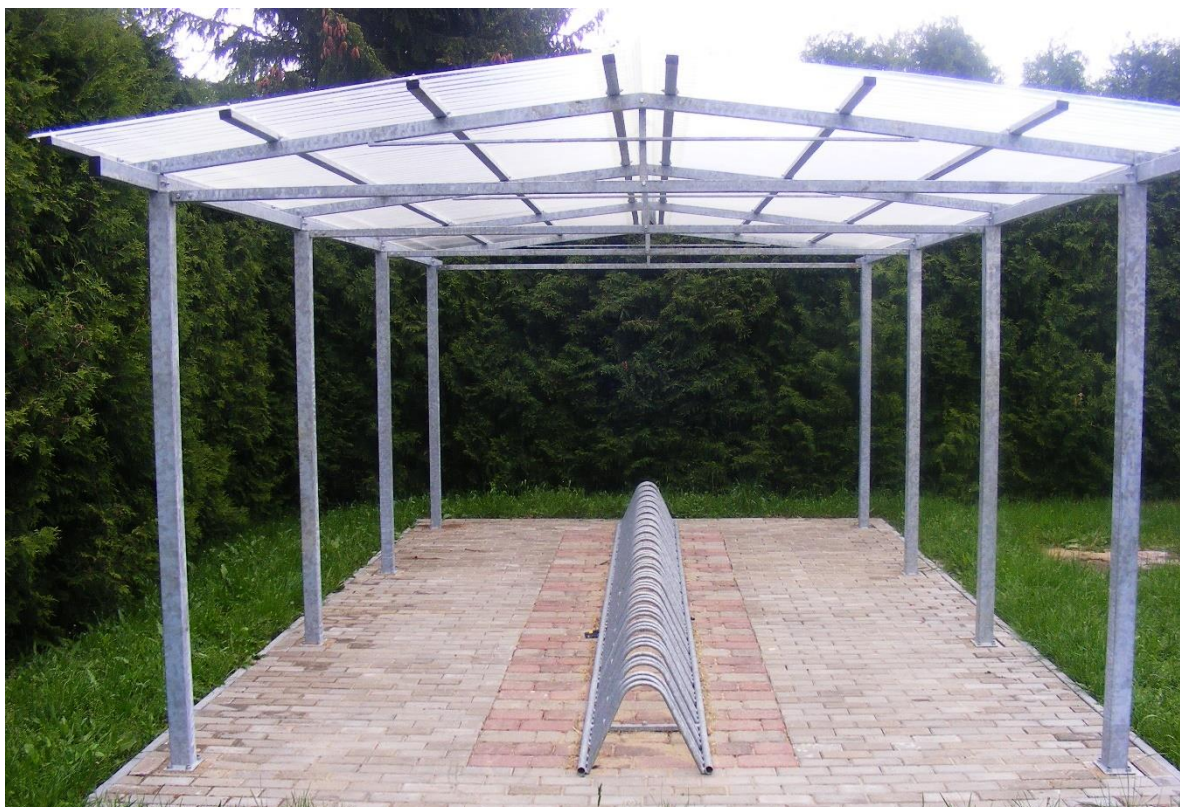
Fot. Zadaszenie na rowery w Zespole Szkół w Dzikowcu