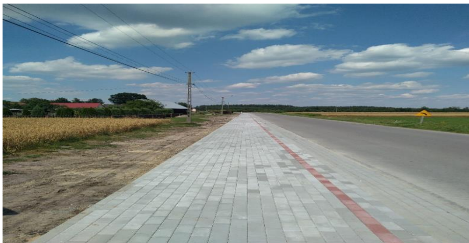
Fot. Wykonany chodnik w miejscowości Lipnica.

W celu polepszenia infrastruktury i transportu oraz komfortu poruszania się po drogach w Gminie Dzikowiec, przy udziale Funduszu Dróg Samorządowych zostały wykonane przebudowy i remonty dróg gminnych: