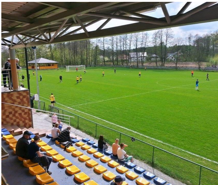
Fot. Stadion Sportowy w Dzikowcu – mecz Klub Sportowy Dzikowiec – Klub Sportowy „Florian” Ostrowy Tuszowskie

Zarząd Klubu stara się zapewnić wszystkim chętnym uczestnictwo i dostęp do zajęć sportowych prowadzonych przez Klub pod nadzorem trenerów z kwalifikacjami. W klubie w seniorskiej klasie „B” gra 36 zawodników. Dzieci i młodzież jest zadowolona, że mogą spełniać swoje marzenia. Zarząd Klubu wraz z zawodnikami dążą do awansu do wyższej ligi rozgrywkowej aby jeszcze bardziej wypromować Gminę Dzikowiec na skalę powiatu oraz województwa Podkarpackiego. Zaplecze którym dysponuje klub, znacznie wyróżnia się w powiecie na tle okolicznych kompleksów sportowych co jeszcze bardziej motywuje do osiągnięcia wyższych celów sportowych oraz