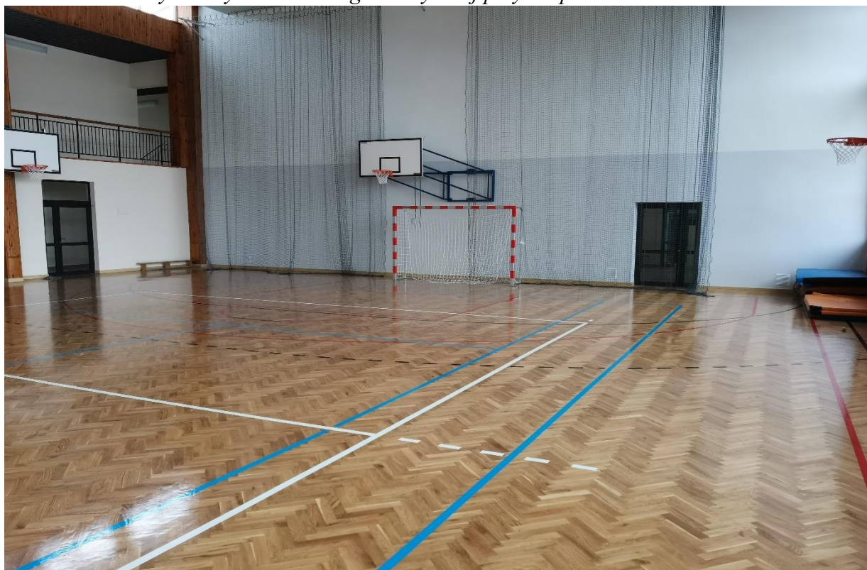
Fot. Wykonany remont sali gimnastycznej przy Zespole Szkół w Dzikowcu