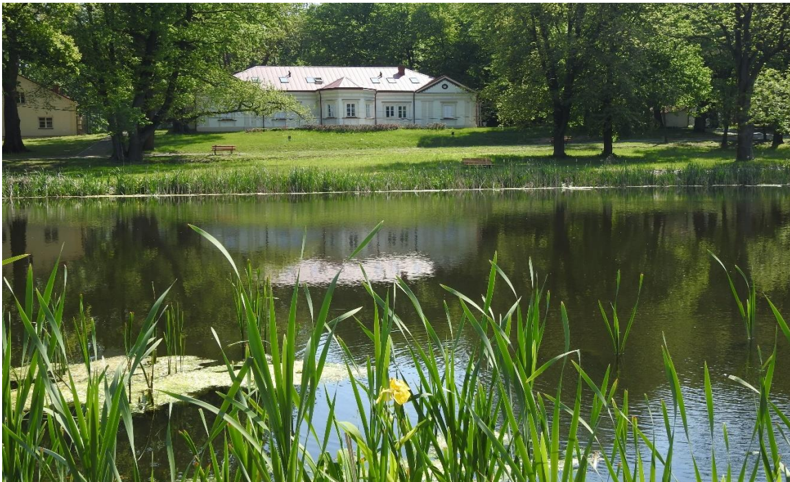
Fot. Zespół dworsko-parkowy w Dzikowcu

Obiekt zespołu dworsko – parkowego jest utrzymywany na bieżąco poprzez utrzymanie zieleni, roślin ozdobnych oraz drzewostanu. Zespół dworsko – parkowy w Dzikowcu odzyskał dawną świetność i służy mieszkańcom naszej gminy.