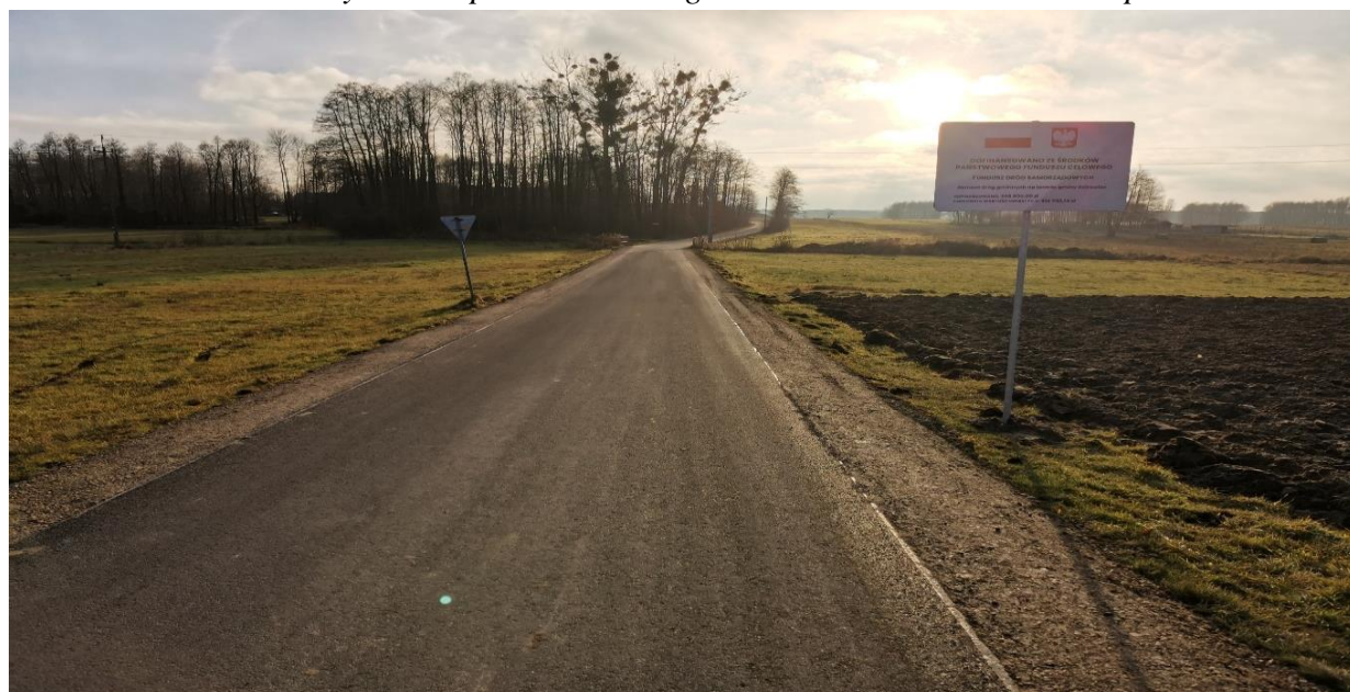
Fot. Wykonany remont drogi gminnej nr 104 259 R Mechowiec – Zagrody Mechowieckie