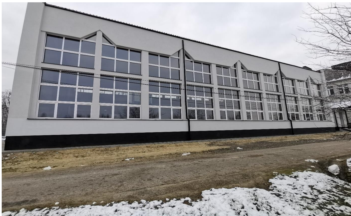
Fot. Wykonany remont sali gimnastycznej przy Zespole Szkół w Dzikowcu

i drzwiowej oraz termomodernizację sali gimnastycznej. Koszt zadania inwestycyjnego wyniósł 1 004 164,93 PLN. Gmina Dzikowiec uzyskała na to zadanie dofinansowanie z Ministerstwa Sportu w ramach programu „Sportowa Polska 2019” w kwocie 567 400,00 złotych.