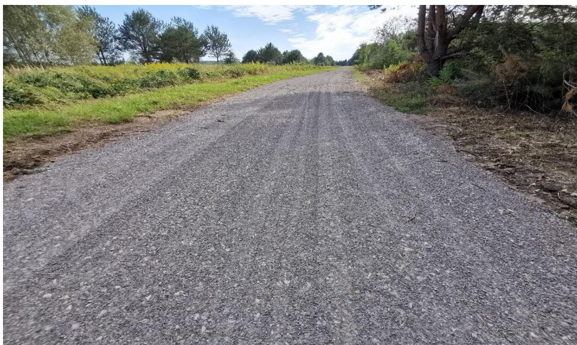
Fot. Wykonana droga dojazdowa do pól w miejscowości Nowy Dzikowiec