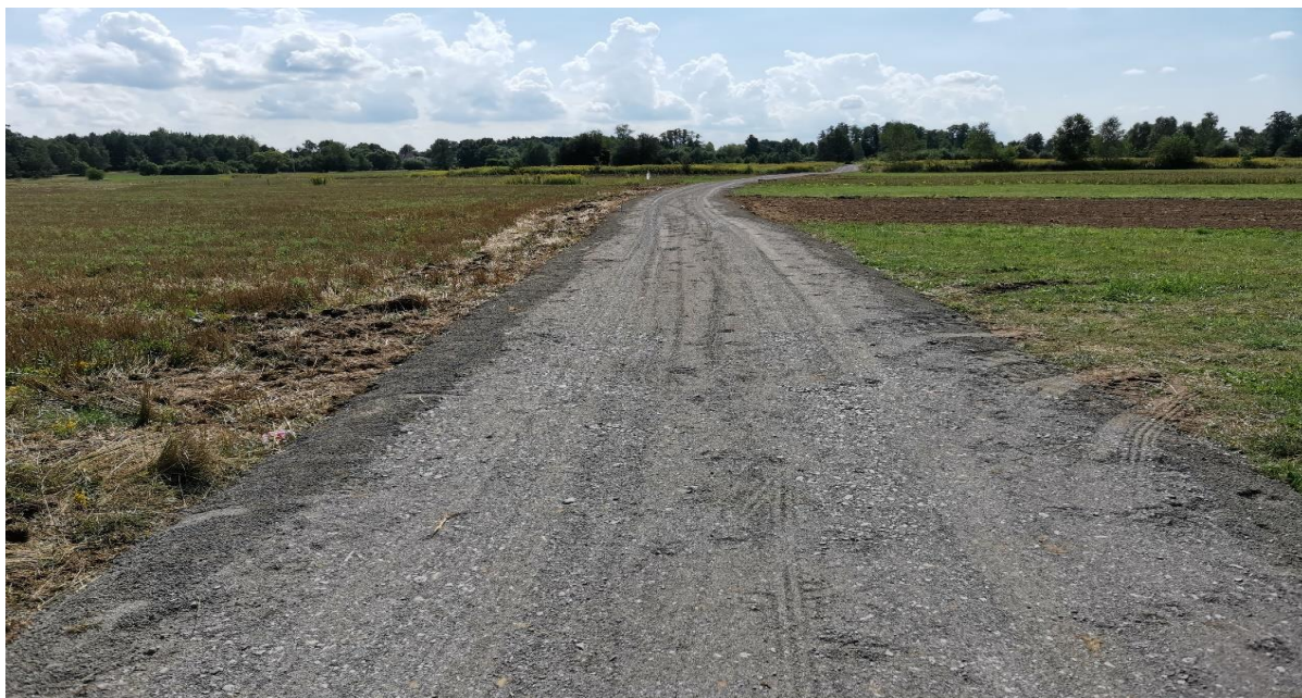
Fot. Wykonana droga dojazdowa do pól w miejscowości Wilcza Wola

Przy udziale dofinansowania z budżetu Województwa Podkarpackiego w wysokości 72 000,00 zł zmodernizowane zostały drogi dojazdowe do pól w miejscowości Wilcza Wola i Nowy Dzikowiec. W ramach tego zadania wykonano nawierzchnie z tłucznia kamiennego o łącznej długości 1150 metrów. Całkowity koszt niniejszej inwestycji wyniósł 88 494,45 zł.