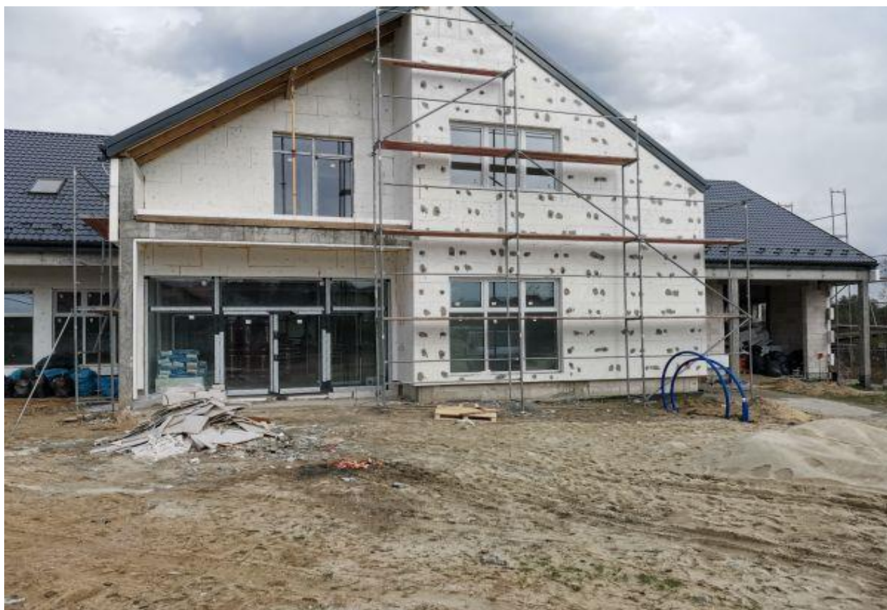
Fot. Rozbudowa i przebudowa budynku wielofunkcyjnego w Kopciach

W 2020 roku kontynuowano prace budowlane w ramach zadania inwestycyjnego pn.: „Rozbudowa, przebudowa budynku wielofunkcyjnego w Kopciach”. Do końca roku 2020 udało się wykonać rozbiórkę części budynku, wykonać fundamenty, ściany nośne i działowe, więźbę dachową wraz z przykryciem, zamontowano drzwi zewnętrzne oraz okna. Realizacja zadania będzie trwać do roku 2021 roku. Termin zakończenia prac to 31.12.2021 rok. Zadanie inwestycyjne zostało dofinansowane z budżetu państwa w ramach Rządowego Funduszu Inwestycji Lokalnych w kwocie 565 328,00 PLN.